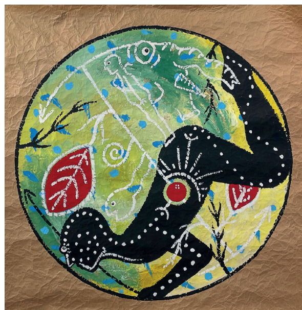
Sans titre - 120x120cm - peinture acrylique sur kraft © Dominique Spiessert. Paris, adagp 2025